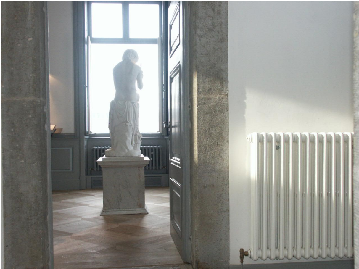
Schloss Benrath seit 1996 unter Denkmalschutz und als Weltkulturerbe der UNESCO vorgeschlagen.

Im Jahr 2002 wurde das unter Denkmalschutz stehende Schloss Benrath saniert und restauriert. Hier wurde eine speziell zu der jahrhunderte alten Vertäfelung angepassten Pulverlackierung auf die Gussradiatoren aufgebracht.