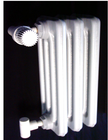
Sonderpulver Schloss Benrath