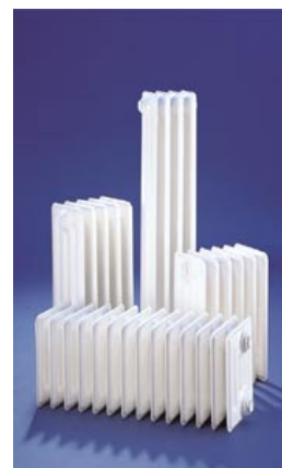
Stahlradiatoren in Standard weiß RAL 9010