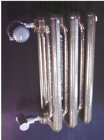
Gusseisen mit Klarlackpulver

Eine einzigartige Ausführung ist auch die Pulverbeschichtung mit einem Klarlack ohne Grundierung. Hierbei wird ein rustikales Bild erschaffen, das eine historische Optik wie von den Anfängen der Gussheizkörper schafft.