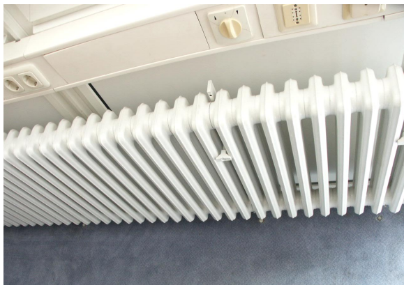
Leicht zugängliche Radiatorenfläche. Bild zeigt einen ca. 33 Jahre alten Gussradiator. Die Reinigung stellt kein Problem dar.