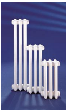
Gußradiatoren in Standard weiß RAL 9010