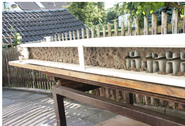
Stark verunreinigte Konvektorenfläche bei Standardplatten. Das Bild zeigt einen Schlafzimmerheizkörper nach 11 Jahren. Zur Reinigung müssen die Verkleidungsbleche oder der gesamte Heizkörper demontiert werden.